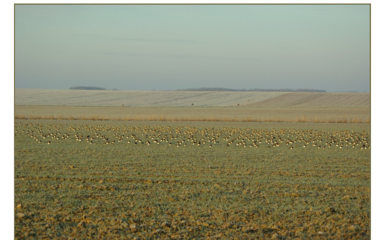
Rassemblement de Vanneaux huppés et de Pluviers dorés (12-12-2012).

A partir de 2015, des MAE systèmes seront proposées sur la ZPS Beauce et Vallée de la Conie. Des informations concernant ce nouvel outil seront apportées en 2014.