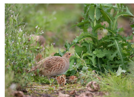
Durant leurs 3 premières semaines, les poussins de perdrix se nourrissent exclusivement d'insectes.