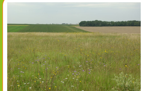
Ces surfaces non-cultivées permettent de varier la mosaïque paysagère.

Au fil du temps, des espèces végétales sauvages s'installent attirant ainsi de nombreux insectes qui sont essentiels à la nutrition de nombreux oiseaux . Pour la plupart de ces fleurs sauvages, elles sont inféodées aux milieux stables et ne sont pas concurrentielles avec les cultures.