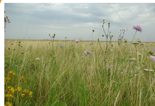
Couvert d'intérêt avifaunistique composé de graminées, de légumineuses et de fleurs sauvages.

Les MAEt permettent également d'indemniser l'entretien de haies, plus de 14 000 ml sont sous contrats à hauteur de 0,28 ou 0,52€/ml pour indemniser l'entretien d'un ou deux côtés respectivement.