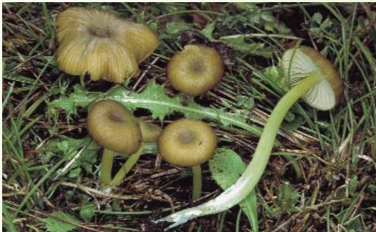
Entolome à pied vert ( Entoloma incanum )