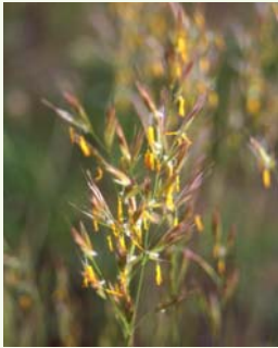
Brome dressé ( Bromus erectus )