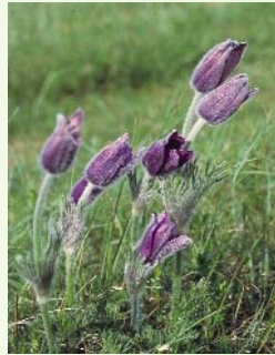
Anémone pulsatile ( Pulsatilla vulgaris )